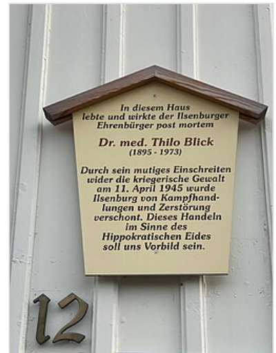
Gedenktafel am Wohnhaus in der Hochofenstraße (2022)